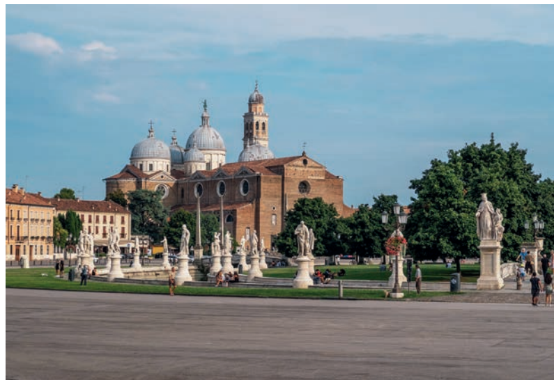
Kathedrale von Padua